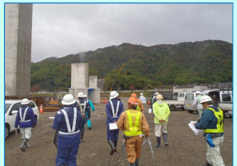
工事安全連絡会主催による安全パトロールを開催しました。(野田川橋梁にて)