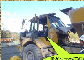
重ダンプの運転席に乗せてもらったよ！

京都府道路公社では、野田川大宮道路において自然にやさしい道づくりを進めています。その一環として「コナラ」の植栽に必要な堆肥づくりのため、11月19日（火）大宮南小学校3年生のみなさんと一緒に落ち葉拾いをしました。ちよっぴり寒かったけど天候にも恵まれ、みんな汗だくになって落ち葉を集めてくれました。集めた落ち葉は現場に設置した木枠に入れて腐葉土を作ります。来年の秋にはカブトムシの幼虫がいるかもしれません。作業の前にはトンネル工事の現場見学もしてもらいました。みなさん来年もよろしくね！！