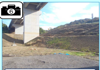
野田川橋梁下の準備工(草刈)が完了しました。