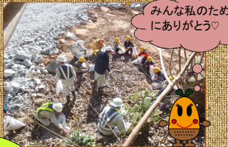
みんな私のためにありがとう