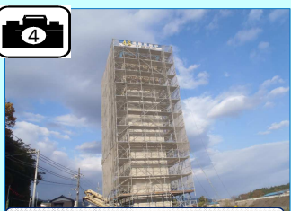
最後のコンクリート打設が終わりました。