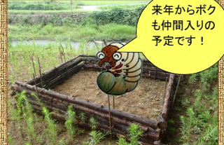
来年からボクも仲間入りの予定です！