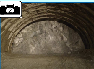
切羽(トンネル先端部)の状況です。