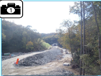
トンネル掘削土(ズリ)で道路の盛土をしています。