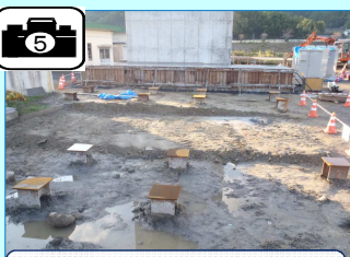
ベントの基礎杭が完了。この上にコンクリート基礎を作り、ベントを建てます。