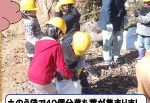
土のう袋で40個分落ち葉が集まりました。