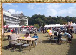
たくさんの来場者で賑わいました。

10月27日（日）に舞鶴赤れんがパークで開催された赤れんがフェスタにおいて、京都縦貫自動車道や山陰近畿自動車道のPRをしてきました。約2万人の来場者で賑わいました。