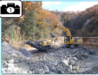
トンネル掘削土(ズリ)をガラバゴスという重機で小割りしています。