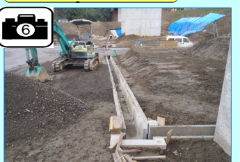
野田川橋梁下に排水路を設置しています。