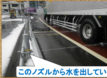
このノズルから水を出しています。