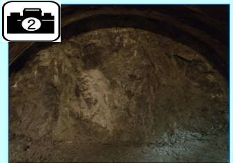
切羽(トンネル先端部)の状況です。